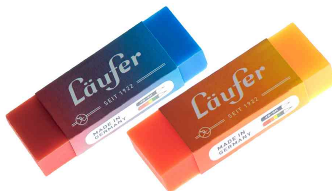
Gomme en plastique PLAST COLOR