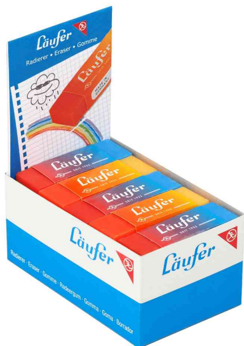
Gomme en plastique PLAST COLOR, en présentoir de 20