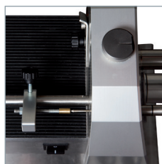
Einstellen der Kürzungslänge.