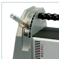
Schleifen der Elektrode im gewünschten Winkel.