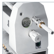
Den Handgriff drehen, um die Elektrode zu kürzen.