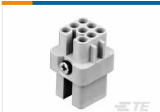
TE Teilnr.:T2020082201-000 HD-008-F