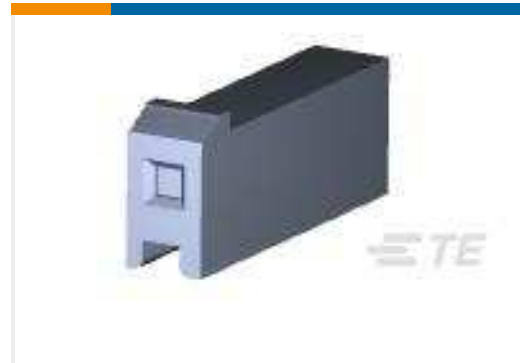
TE Teilnr.:640250-1 01P SL156 HSG W/LCK RAMP NATL