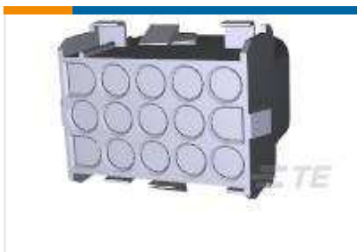
TE Teilnr.:1-480711-9 15P UMNL CAP HSG BLK