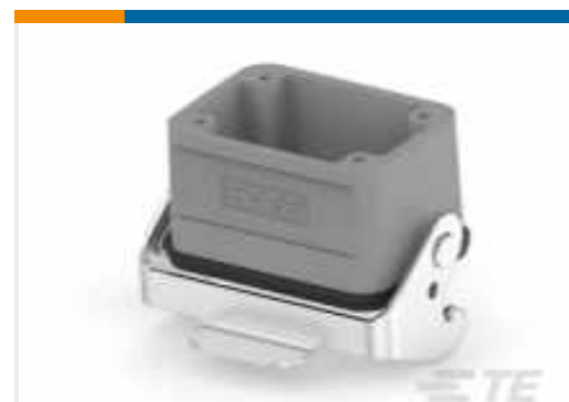
TE Teilnr.:T1730060000-000 H6B-TBF-T