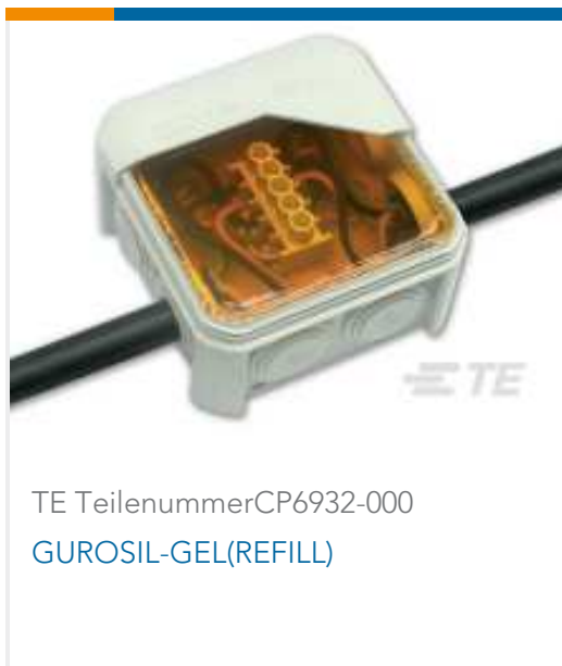
TE TeilenummerCP6932-000 GUROSIL-GEL(REFILL)