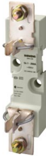
NH-SICHERUNGSUNTERTEIL GR.1, 1-POLIG 250A 690V(1000V) FLACHANSCHLUSS