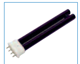
Ersatz-UV-Lampe für [2+3]