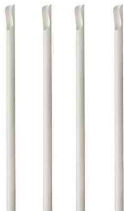
Paille en papier avec cuiller "pure", blanc

- idéal pour les cocktails, boissons, limonades et autres boissons rafraîchissantes