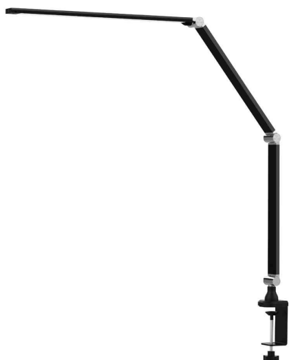
Lampe de bureau à LED Ray