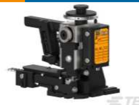
TE Teilenummer2836774-1 OC-AT-S-FM-096F161O-040-0898