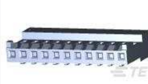
TE Teilenummer4-644460-1 11P MTA156 CONN ASSY 18AWG ORA