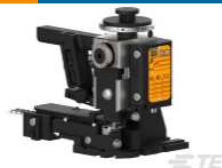
TE Teilenummer2836359-1 OCEAN_2.0_Applicator-S-055F062O