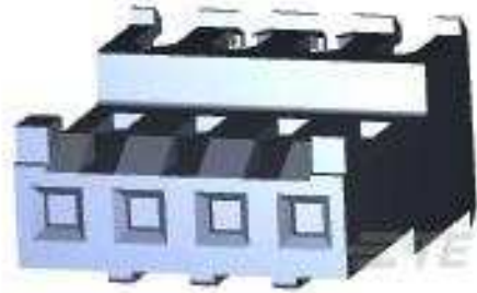
TE Teilenummer3-644718-4 04P MTA156 CONN ASSY 18AWG ORA