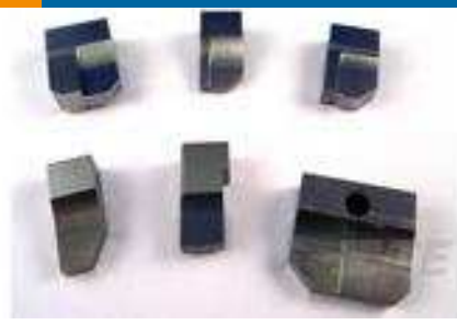
TE Teilenummer2-1633127-7 ANVIL, COMBINATION .042