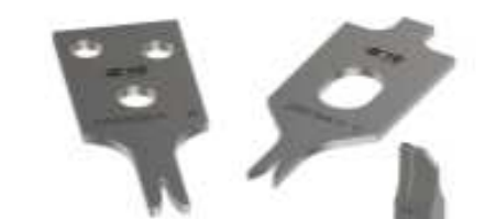
KIT REPRESENTATION ONLY