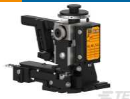
TE Teilenummer2836313-1 OC-AT-S-FM-080F154O-040-0940