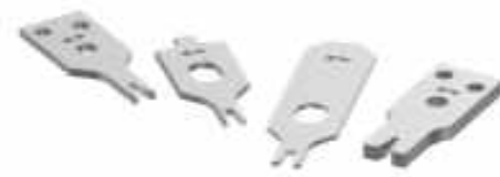
CRIMPER REPRESENTATION ONLY