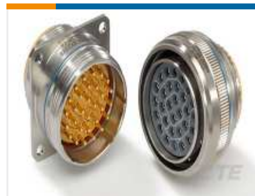
TE TeilenummerZPF000000000008767 983-6SE 10-06 SN