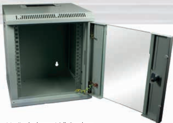
Veränderbare 10" Streben Türen umbaubar