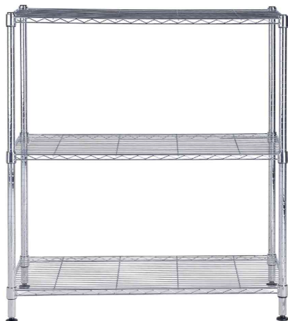
Etagère multifonction MOBI3M