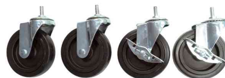
Kit de roues pour les étagères multifonction MOBI