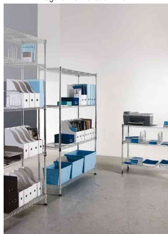
Visuel de référence: montre le produit en utilisation