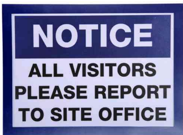
Magnetrahmen DIN A4, blau