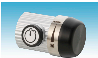
Abb. 3: Steuerkopf

Mit dem Drehschalter lässt sich die LED Nystagmusbrille ein- bzw. ausschalten und gleichzeitig die Helligkeit regulieren.