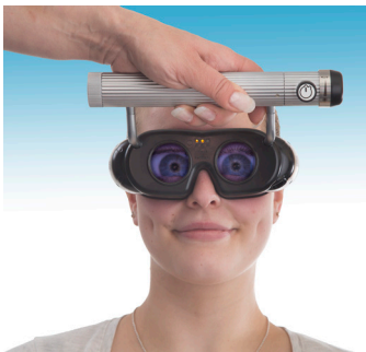
Abb. 1: LED Nystagmusbrille Typ 803

Moderne Vestibularisdiagnostik erfordert eine hohe Präzision bei der Suche nach Spontan- oder Provokationsnystagmus. In vielen Fällen konnte erst mit der technisch aufwändigen Elektronystagmografie (ENG) die richtige Diagnose erstellt werden. Hierzu stellen unsere Nystagmusbrillen eine einfach zu handhabende Alternative dar. Mit der neuen LED Nystagmusbrille bieten wir eine verbesserte Version unserer bewährten Nystagmusbrillen nach Frenzel und Blessing an. Das Modell Typ 803 wird für kurzfristige Untersuchungen, im mobilen Einsatz, verwendet.