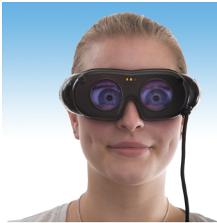
Abb. 1: Nystagmusbrille Typ 801-A

Moderne Vestibularisdiagnostik erfordert eine hohe Präzision bei der Suche nach Spontan- oder Provokationsnystagmus. In vielen Fällen konnte erst mit der technisch aufwändigen Elektronystagmografie (ENG) die richtige Diagnose erstellt werden. Hierzu stellen unsere Nystagmusbrillen eine einfach zu handhabende Alternative dar. Mit der neuen LED Nystagmusbrille bieten wir eine verbesserte Version unserer bewährten Nystagmusbrillen nach Frenzel und Blessing an.