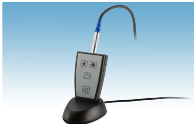
Abb. 3: Akku-Schaltgehäuse Typ 8.0121.01 mit Ladeschale Typ 8.0121.02

Mit dem Akku-Schaltgehäuse werden zum einen die Funktionen der LED Nystagmusbrille angesteuert, zum Anderen ist mit dieser Variante ein (Stromnetz-) unabhängiges Arbeiten, wie z.B. bei Drehstuhluntersuchungen problemlos durchführbar.