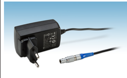
Abb. 5: Netzteil Typ 8.0121.04

Das Netzteil versorgt die Versionen LED Nystagmusbrille Typ 801-S und 821-S mit Strom.