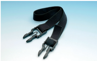
Abb. 2: Clip-Kopfband Typ 5.01.08

Das Clip-Kopfband sorgt für eine sichere Fixierung der Nystagmusbrille vor den Augen des Patienten und ermöglicht so eine unkomplizierte Suche nach Provokationsnystagmus, z.B. durch Kopfschütteln, Lagerungs- oder Drehstuhluntersuchungen.