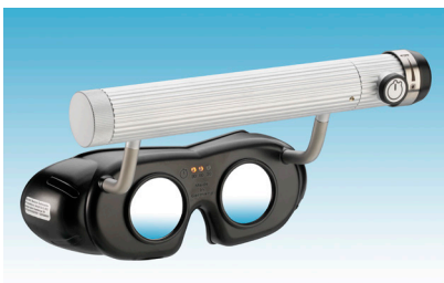
Abb. 2: Nystagmusbrille Typ 803

Mit der LED Nystagmusbrille Typ 803 haben Sie die Möglichkeit, kurzfristige Untersuchungen am Patienten durchzuführen. Dieses Modell ermöglicht ein schnurloses Arbeiten und ist (Stromnetz-) unabhängig einsetzbar. Die Stromversorgung der Nystagmusbrille erfolgt durch den fest nach oben montierten regelbaren Batteriegriff, der zur Aufnahme von drei Batterien der Größe C LR14/AM-2 (Babyzellen) à 1,5 Volt dient. (Batterien sind nicht im Lieferumfang enthalten!).