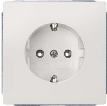
DELTA style rot (WSV) SCHUKO ohne Krallen 68x68mm 10/16A 250V