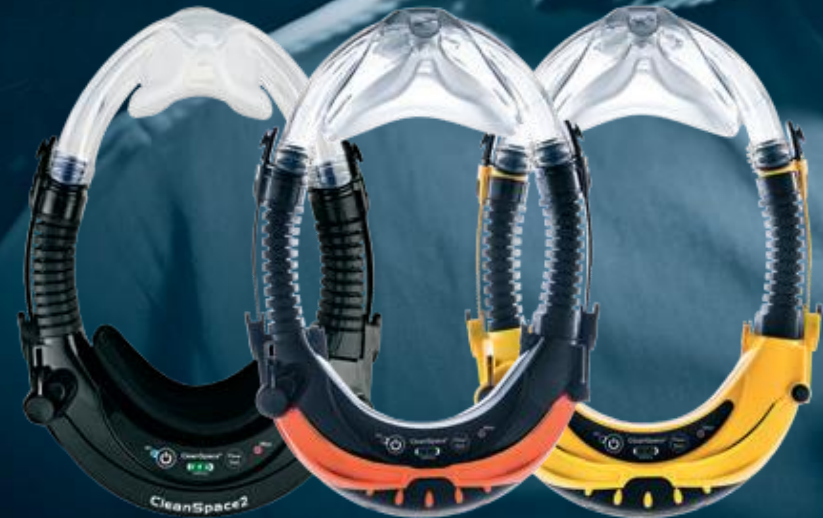
CLEANSACE2™ CLEANSACE ULTRA CLEANSACE EX