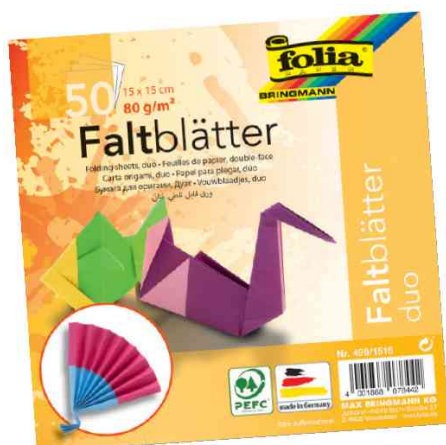
Papiers pour le pliage "Duo"