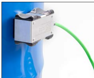
Erdungsmagnet EM-HX - für Metallfässer bis 200 L, Bestell-Nr. 217-934-J0