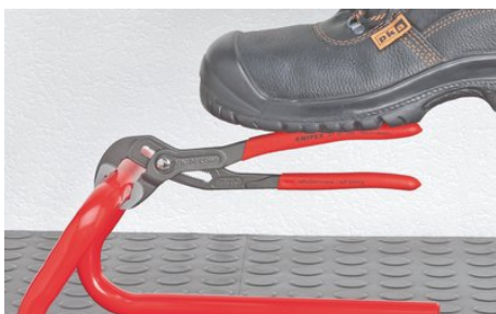
Tegen de draairichting in verzette tanden zorgen voor een zelfklemmend effect en verhinderen wegglijden aan het werkstuk