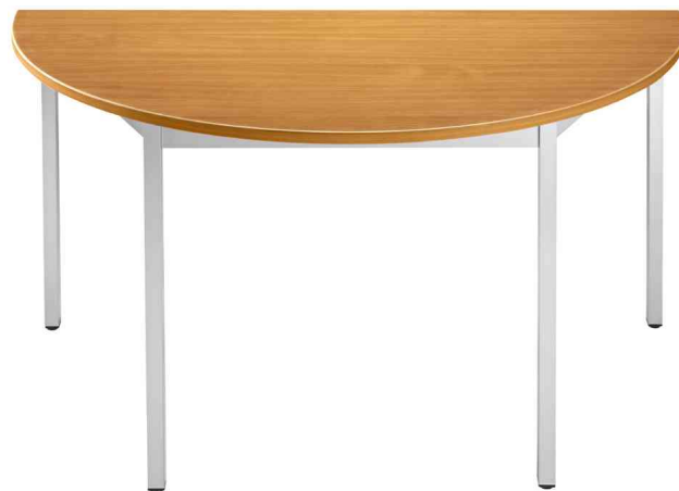
Visuel de référence: Table de réunion modulaire, demi-rond, merisier