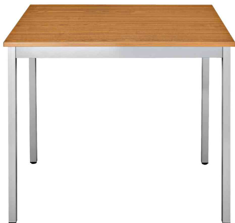
Visuel de référence: Table de réunion modulaire, rectangulaire, merisier

- idéal dans les salles de repos, les salles d'attente et les cantines etc.