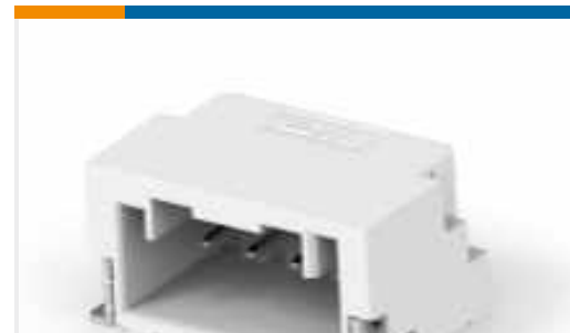
TE Teilnr.:2360545-4 SGI 1.5 HDR, 4P, RA, Key A, Natural