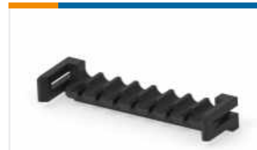
TE Teilnr.:2383410-8 SGI 1.5 TPA, 8P, Black