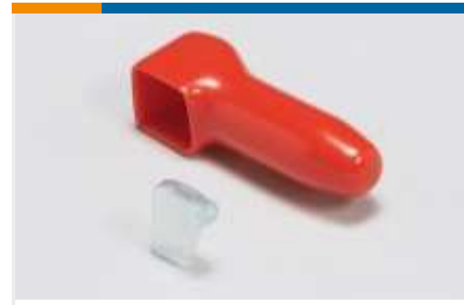
Isoliermuffen und -hülsen(9)