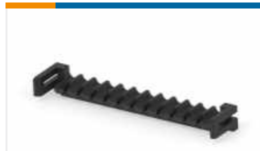
TE Teilnr.:1-2383410-2 SGI 1.5 TPA, 12P, Black