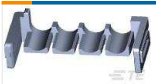
TE Teilnr.:177920-1 POWER DBL LOCK PLATE 3.96MM 4POS