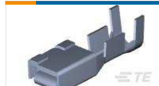
TE Teilnr.:179956-2 DYNAMIC D-5 REC CONT. M FORM