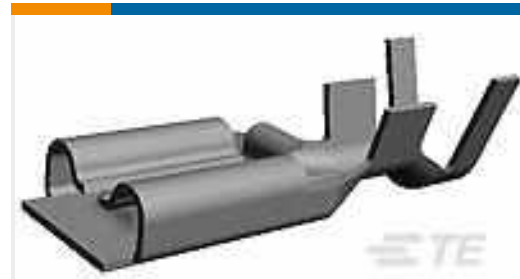
TE Teilnr.:173722-1 187 PL EX REC. 26-20AWG PTBR