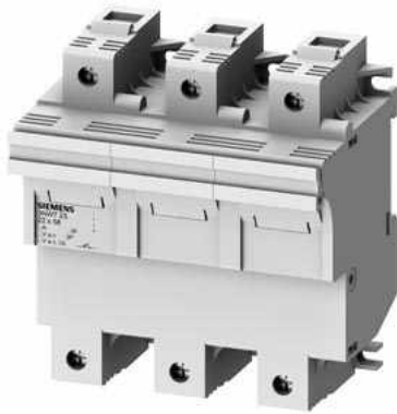
SENTRON, Zylindersicherungshalter, 22x58 mm, 3-polig, In: 100 A, Un AC: 690 V