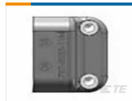
TE Teilenummer ZPF00000000107200 787-8055-11M