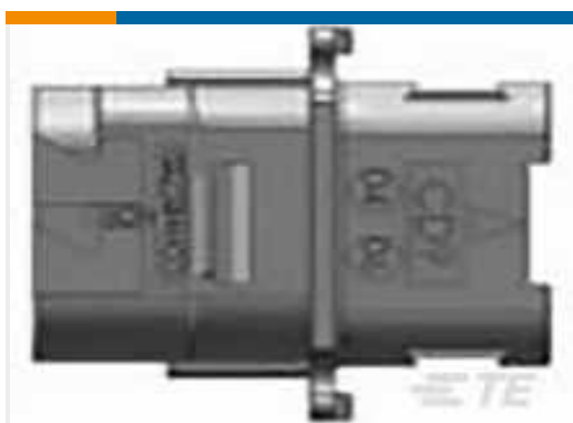
TE Teilenummer ZPF00000000104589 DMC-MD 26 D