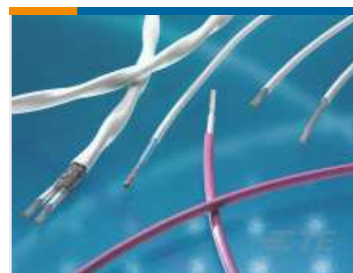
TE Teilenummer 698521-000 55A0816-16-9