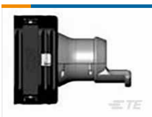
TE Teilenummer ZPF00000000105765 787-8055-12M