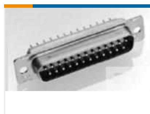
TE Teilenummer 205162-5 AMPLIMITE,ASY,PLUG,109,1