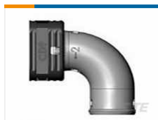
TE Teilenummer ZPF00000000102764 787-8055-30M