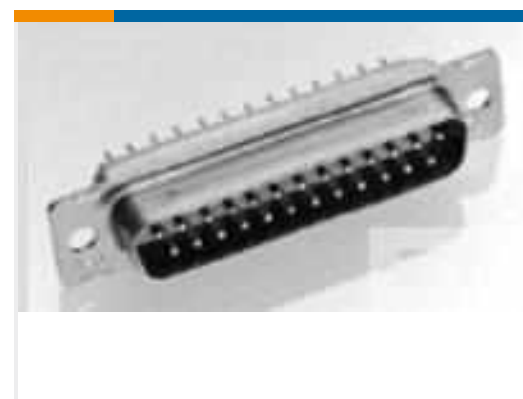
TE Teilenummer 205164-6 AMPLIMITE,ASY,PLUG,109,2