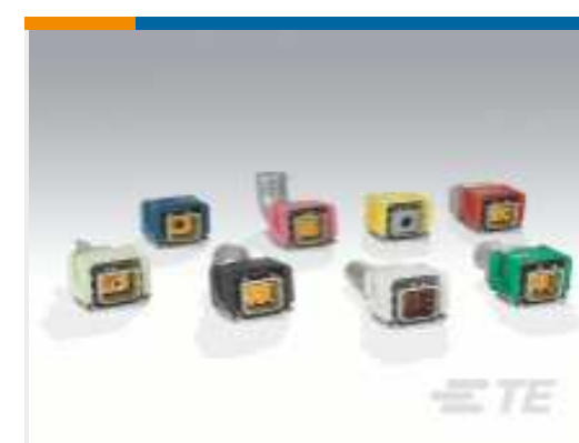
TE Teilenummer ZPF00000000100794 DMC-MD 20 C