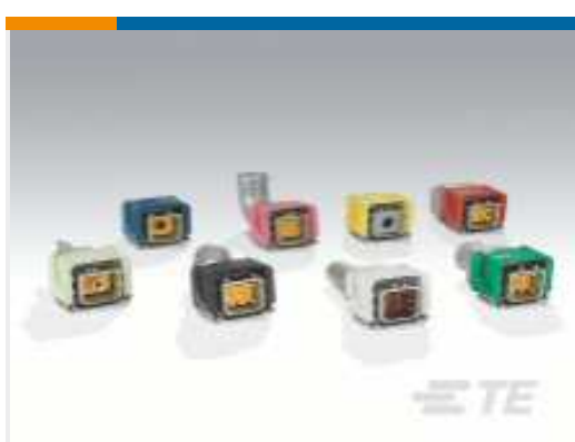
TE Teilenummer ZPF00000000100854 DMC-MD 20 B