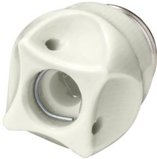
NEOZED-SCHRAUBKAPPE PORZELLAN GR.D02, 63A