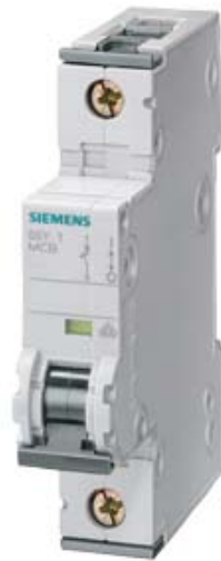
LEITUNGSSCHUTZSCHALTER 230/400V 15KA, 1-POLIG, B, 32A, T=70MM