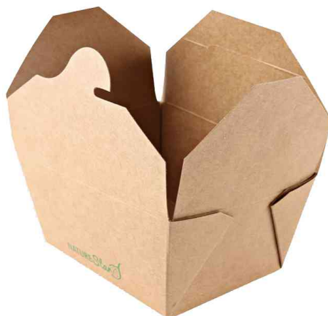
Visuel de référence : boîte à snack, ouvert