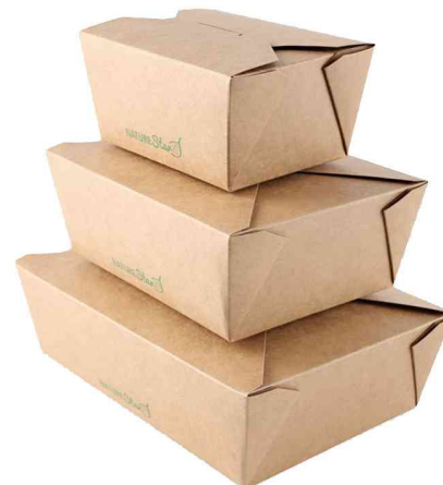
Visuel de référence : boîtes à snack