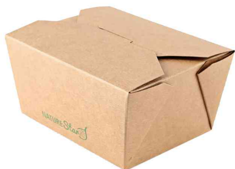
Visuel de référence : boîte à snack