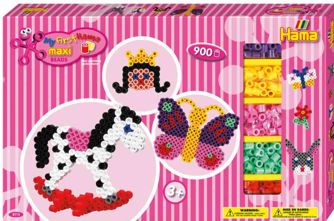
Bügelperlen maxi "Mädchen", Geschenkpackung

ACHTUNG! Nicht geeignet für Kinder unter 36 Monaten, wegen verschluckbarer Kleinteile.