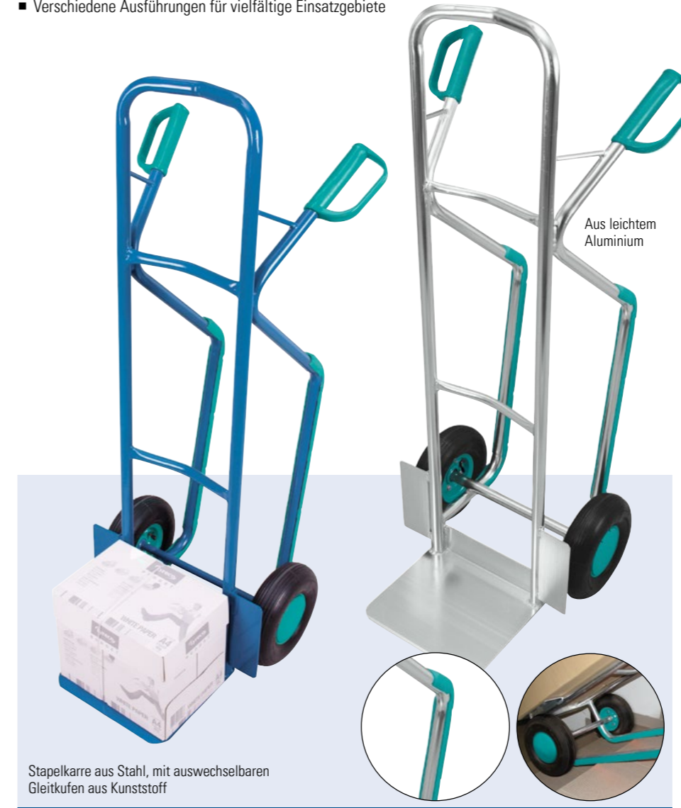
Aus leichtem Aluminium