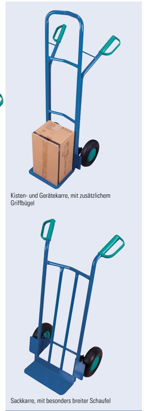
Kisten- und Gerätekarre, mit zusätzlichem Griffbügel