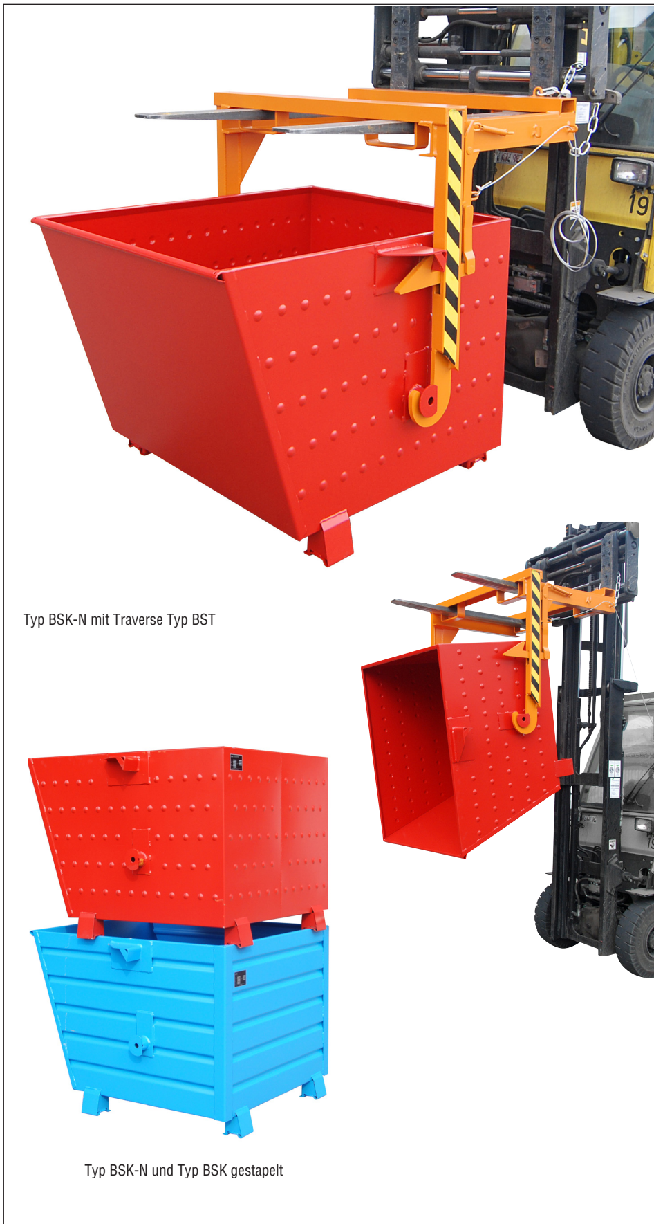
Typ BSK-N mit Traverse Typ BST