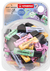
Surligneur BOSS ORIGINAL by Ju Schnee, bonbonnière

Équipement : 60 pièces assorties dans les couleurs : 15 de chaque en nuage de bleu, menthe à l'eau, sorbet abricot, mauve givré