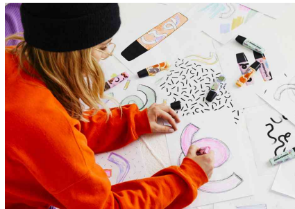
Visuel de référence : présente le produit en utilisation