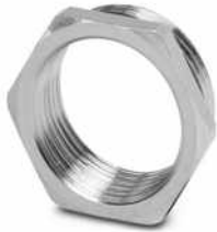
Reduzieradapter, Anschlussgewinde: Pg16, Farbe: silberfarben, mit O-Ring

Bitte beachten Sie, dass die in diesem PDF-Dokument angezeigten Daten aus unserem Online-Katalog generiert wurden. Bitte finden Sie die vollständigen Daten in der Benutzer-Dokumentation. Es gelten unsere Allgemeinen Nutzungsbedingungen für Downloads.