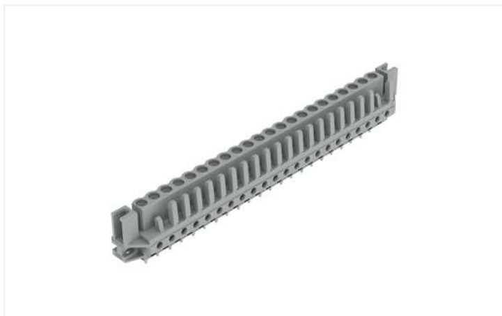
Farbe: ■ grau