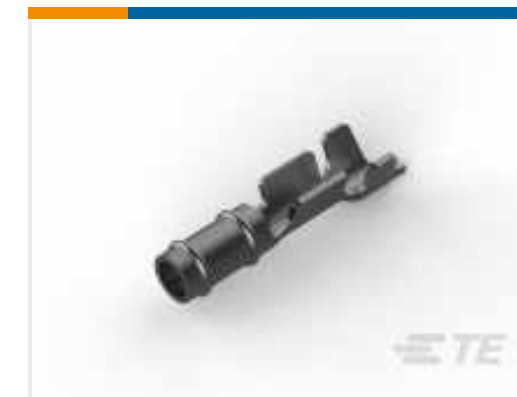
TE Teilnr.: 170137-1 .058 DIA P.C.B REC LP