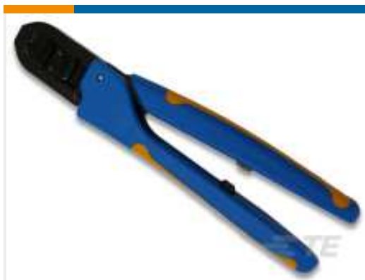
TE Teilnr.: 91507-1 CCII .058 REC P.C. 24-20 ASSY