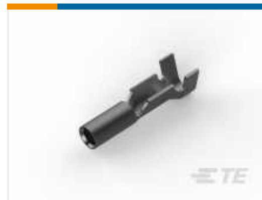
TE Teilnr.: 60940-2 058 PIN REC 24-20 SN/BEUC