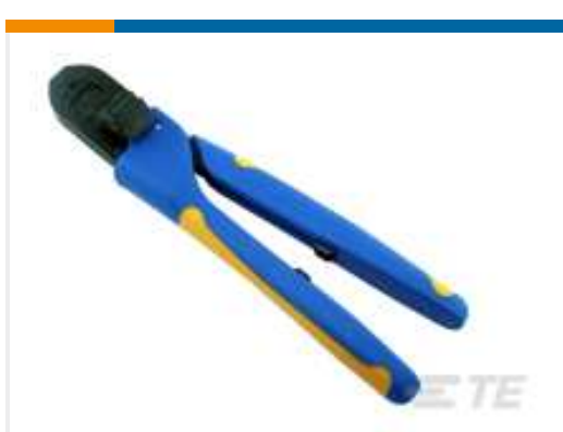
TE Teilnr.: 2031200-1 CCII .058 DIA REC PC CONT 24 ASSY