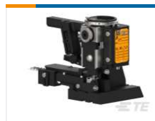
TE Teilnr.: 2-2151427-1 OCEAN_2.0_Applicator-S-055F0800