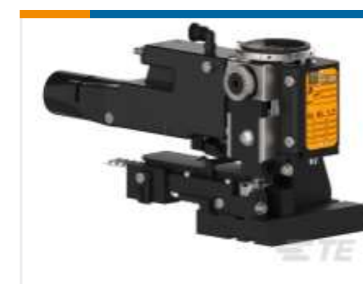
TE Teilnr.: 2-2151427-2 OCEAN_2.0_Applicator-S-055F0800