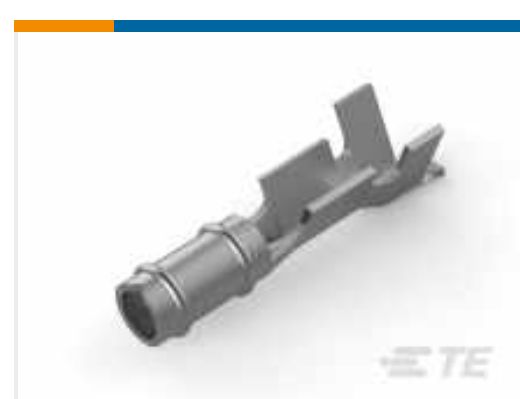
TE Teilnr.: 60939-2 .058 DIA RECPT SN/BEUC