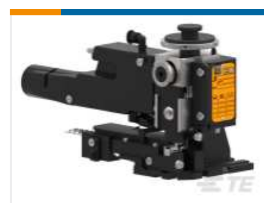
TE Teilnr.: 2151427-2 OCEAN_2.0_Applicator-S-055F0800