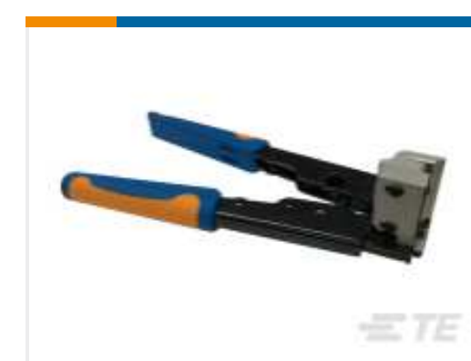
TE Teilnr.: 2305570-1 Strip Terminal Cutter-Side Feed-No Crimp