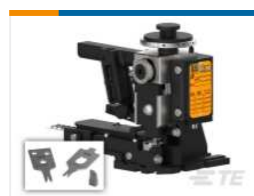
TE Teilnr.: 7-2151427-1 OCEAN_2.0_Applicator-S-055F0800