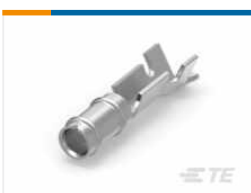
TE Teilnr.: 60804-3 RECPT .058 26-22 SN/BEUC