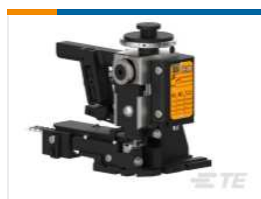
TE Teilnr.: 2151427-1 OCEAN_2.0_Applicator-S-055F0800