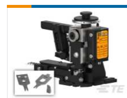
TE Teilnr.: 7-2151427-2 OCEAN_2.0_Applicator-S-055F0800