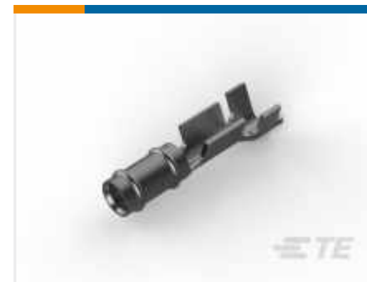
TE Teilnr.: 170136-2 1.47MM DIA PIN RECEPT STRIP