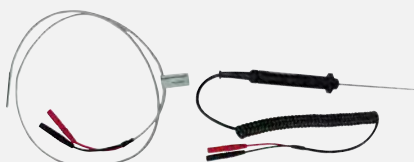
TF220 / TF550