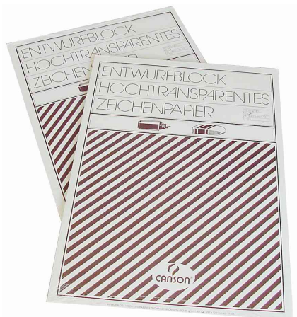
Visuel de référence: Bloc papier dessin