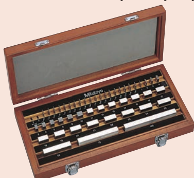
47 db-os acél hasábkészlet