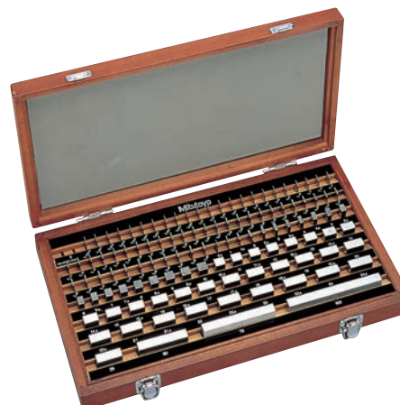
103 db-os acél hasábkészlet