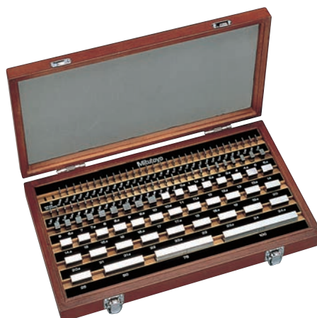
112 db-os acél hasábkészlet