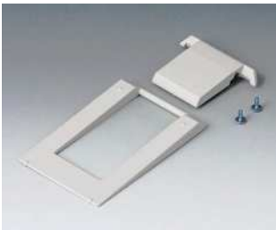
A9250907 Aufstellbügel ABS (UL 94 HB) grauweiß RAL 9002

Technische Änderungen vorbehalten. © OKW Gehäusesysteme, Buchen/Deutschland.