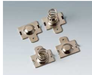
A9190012 Kontaktfedern-Set, 4 x AA Stahl vernickelt