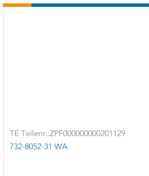
TE Teilnr.:ZPF000000000201129 732-8052-31 WA