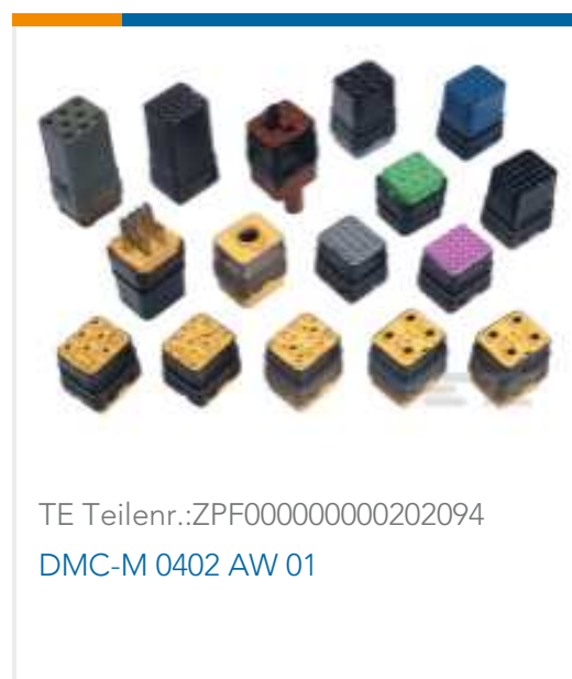
TE Teilnr.:ZPF000000000202094 DMC-M 0402 AW 01