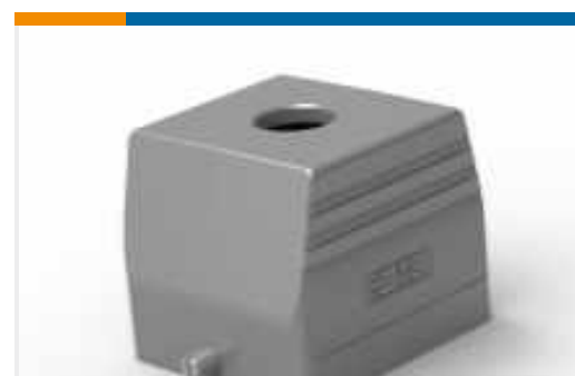
TE Teilnr.:T1320320125-000 H32B-TG-RO-M25