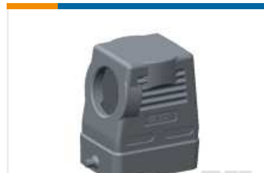
TE Teilnr.:T1330060132-000 H6B-TSH-M32