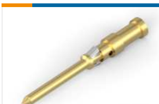
TE Teilnr.:T2020011008-000 DDM-0.75