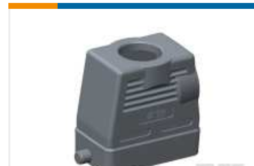
TE Teilnr.:T1340100132-000 H10B-TGH-RO-M32