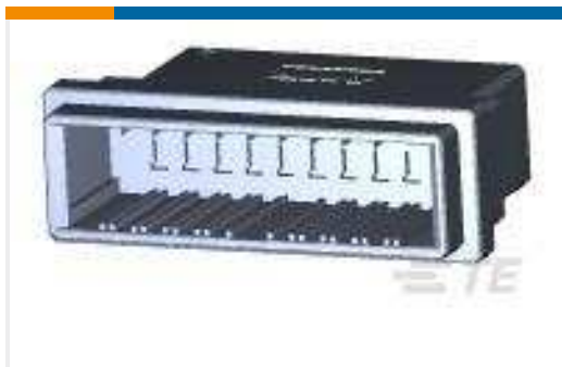
TE Teilnr.:178964-8 DYNAMIC D-3 W-T-W TAB HSG 20P