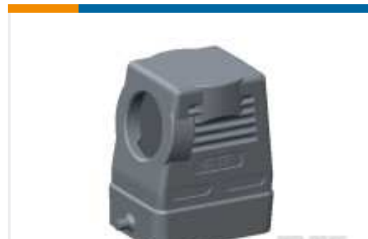
TE Teilnr.:T1330060125-000 H6B-TSH-M25