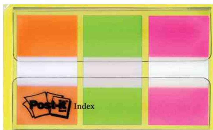
9082917: Haftmarker Index, orange/limonengrün/pink