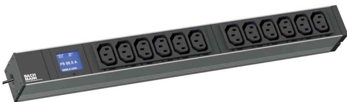
19" Steckdosenleiste "BlueNet BN0500", 12-fach