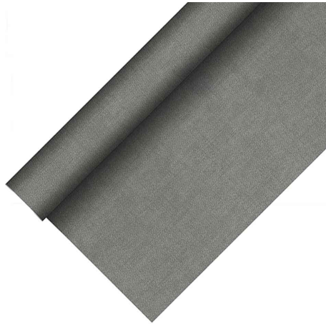
Tischdecke "ROYAL Collection Plus", grau