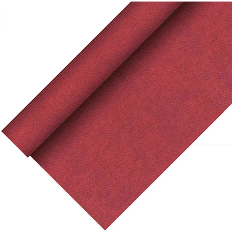
Tischdecke "ROYAL Collection Plus", bordeaux