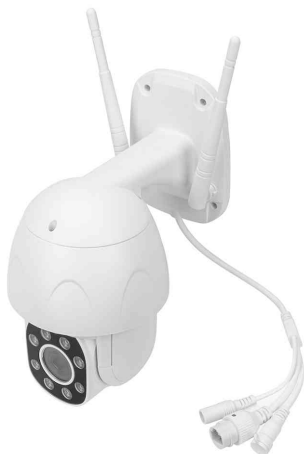
Smarte Full HD PTZ-Außenkamera

- für eine Vielzahl an Einsatzmöglichkeiten konzipiert, beispielsweise für die Überwachung von Haus, Garten, Garage oder Carport