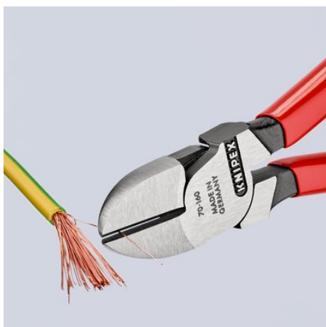
Czyste cięcie cienkiego drutu miedzianego nawet końcówką ostrzy