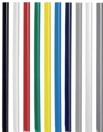
(1) Peignes à relier standard