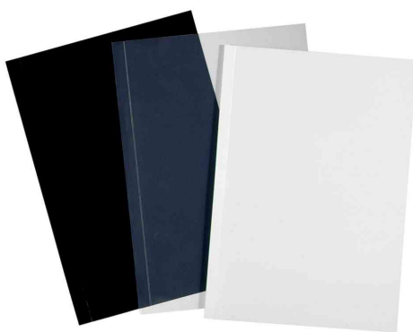
(2/4) Pochettes pour peignes à relier / couverture sans fenêtre