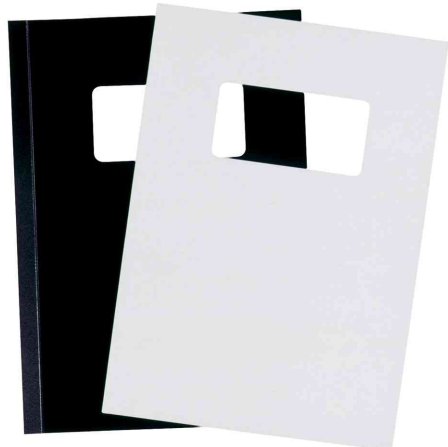
(4) Couverture avec fenêtre