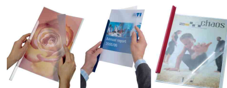
Peigne à relier, exemple d'utilisation