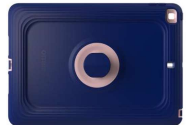
SPACE EXPLORER 77-83272 840104262924