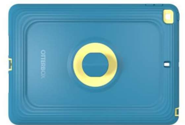
GALAXY RUNNER 77-83271 840104262917