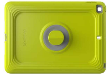
MARTIAN 77-83270 840104262900