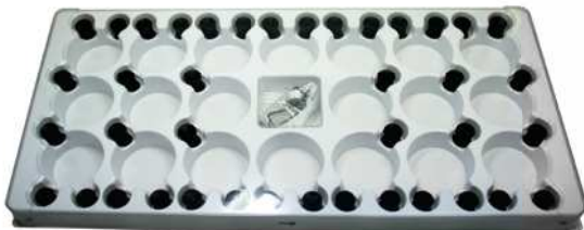
40 Stk. für Shape oder Pure