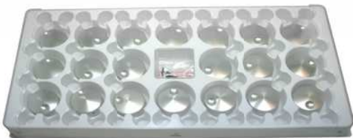
20 Stk. für Shaper, Robot, Space, Dimple, Cone, Medic