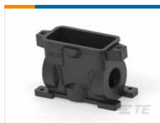
TE Teilnr.: T1952160121-009 H16BPR-SGRHC-PG21-EMC-C