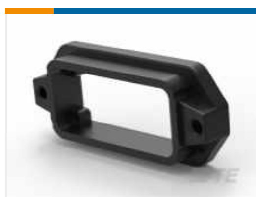
TE Teilnr.: T1932160000-009 H16BPR-AGC-EMC-C