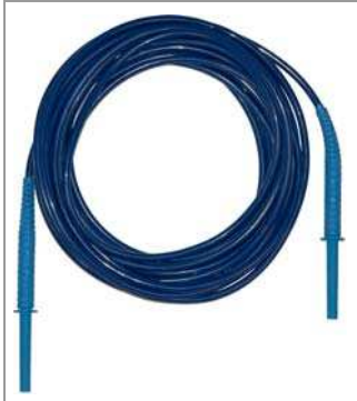
Messleitung MCABLE-10m-blue (Z555R)