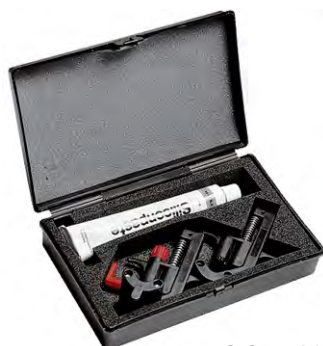
HLS-Set – 244720