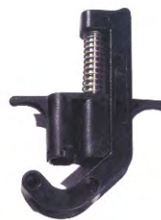
Anschlag – 244722